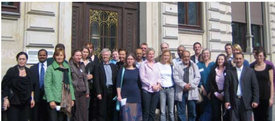
Gruppenfoto: Workshop Regionalizing Oman , ZMO/Universität Leipzig, 25.–26. März 2010