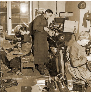
In der Schusterwerkstatt wurde Anleitung zur Selbsthilfe gegeben.