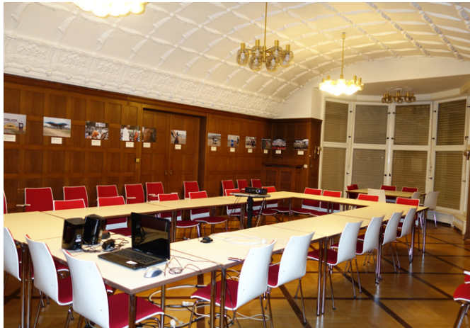
Der Saal wird heute für Besprechungen genutzt.