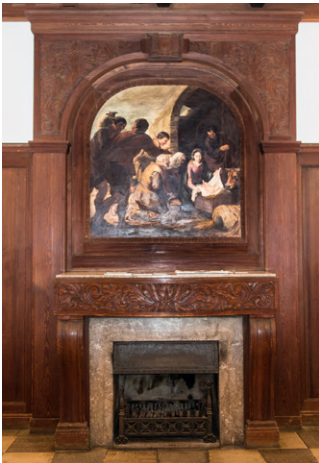
Das Bild über dem Kamin schlummerte lange Zeit auf dem Dachboden.

Während der Herrschaft der Nationalsozialisten wurde der Mittelhof Regierungseigentum. Hierher wurde eine Abteilung