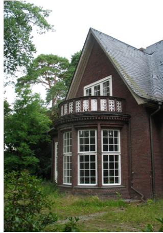
Das Äußere des Mittelhofs hat sich in den letzten 100 Jahren nicht verändert.

der Reichskulturkammer ausgelagert. Das Ende des Zweiten Weltkriegs brachte auch Veränderungen für das große Haus an der Rehwiese. Zunächst nutzten es US-Soldaten als Clubhaus. Zusätzlich bekam es einen un-