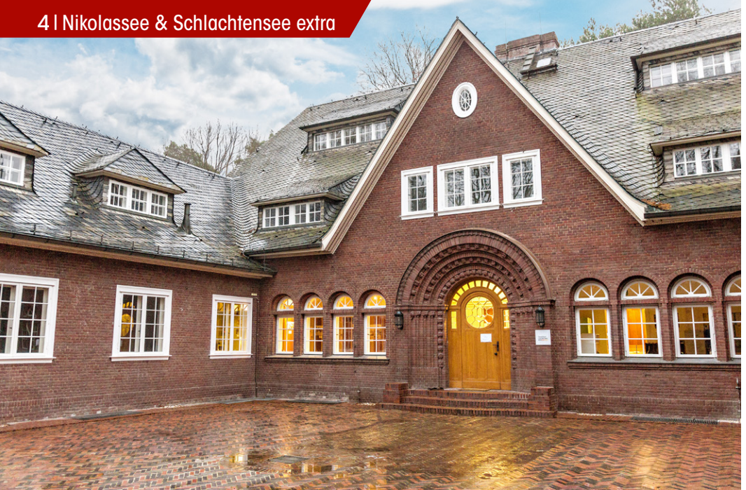
Das Haus ist rund um den namensgebenden „Mittelhof“ gebaut.