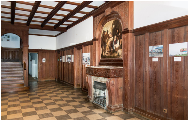
Die Eingangshalle ist unverändert erhalten geblieben.