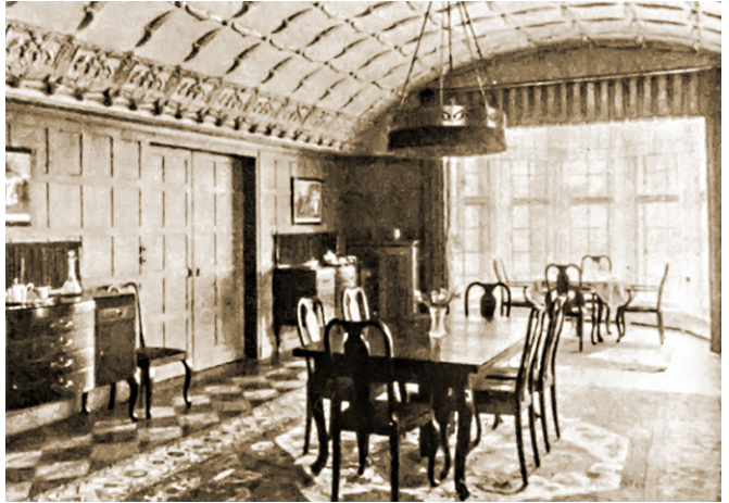
Im Saal wurde festlich getafelt.

Vieles aus den Anfängen des Hauses blieb bis heute erhalten. So ist die detailreich geschmückte Decke des Holzgetäfelten Esszimmers der Familie im besten Zustand. Auch die originalen Fenstergriffe aus Kuhhorn gibt es nach wie vor. Über dem Kamin in der Eingangshalle hängt die Kopie eines Gemäldes von Bartolomé Esteban Murillo (1618 – 1682). Es befand sich lange Jahre auf dem Dachboden und seine