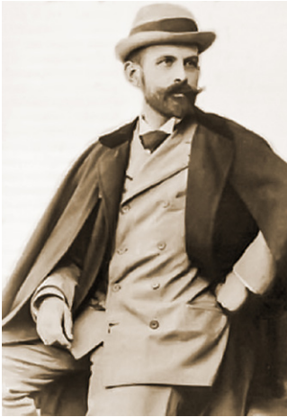
Der Architekt Hermann Muthesius entwarf viele Häuser in Nikolasee.