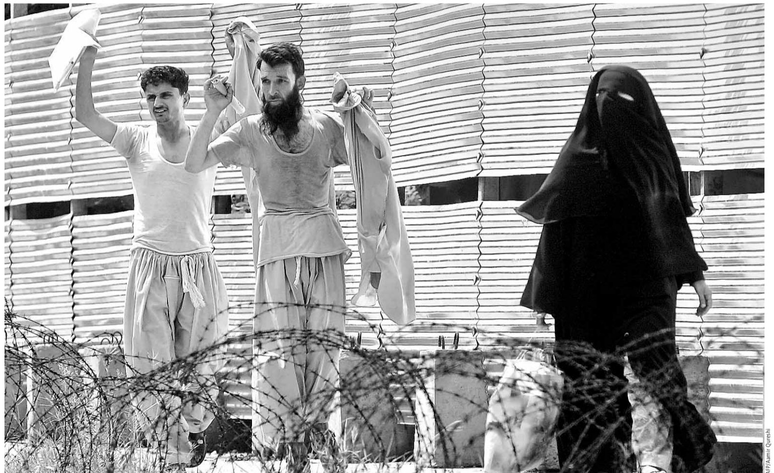
Eine Burka schützt vor bösen Blicken, jedoch nicht vor den Kontrollen der Polizei: Koranschüler ergeben sich den Sicherheitskräften an der Roten Moschee in Islamabad