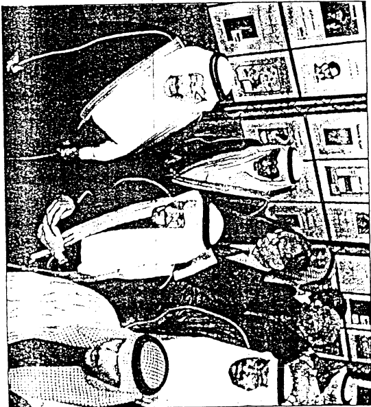
م. هدي يعقبا المعرض المصاحب للندوة

في دراسة الثقافة العربية... تجربة خاصة" يقدمها الدكتور فالح المعجمي وورقة عمل بعنوان "دراسات حول الشرق الأوسط المعاصر" يقدمها الدكتور توماس فليب وكذلك ورقة عمل بعنوان "العناصر والتعبير والحوار بين الثقافات" يقدمها الدكتور غوردون