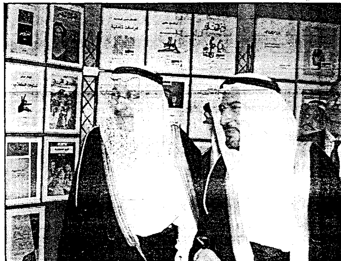
وزير الثقافة يتجول في المعرض المصاحب

لأن الغزو العسكري لم يثبت نجاحه على مر العصور. وكانت فكرة الحضارة الغربية أنها القمة في الرقي والتعامل وأن باقي الحضارات الأخرى ما زال لديها طريق طويل للوصول للرقي، وكان لهذا الموقف تأثيران اثنان اولهما عملي يتمثل في كون المجتمعات الأوروبية المتقدمة لا بد أن تكون مسؤولة أمام ضميرها وأمام التاريخ، فواجب عليها أن تكون وهي صاحبة الحضارة أن ترفع بالأخزين نحو أعلى المستويات والموقف الثاني نظري وذلك بإطلاق الآراء والأفكار لتكوي باقي الحضارات الأخرى.