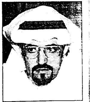
د. سعد الراشد

الرياض - ثقافة اليوم: احتفاء بضيوف مهرجان الجنادرية ٢٠ اقام د. سعد الراشد وكيل وزارة التربية والتعليم لشؤون الآثار مأدبة عشاء لعدد من الأكاديميين والمثقفين والادباء السعوديين المشاركين في المهرجان يذكر بأن المهرجان يعد فرصة مميزة لالتقاء المثقفين والمبدعين من أرجاء الوطن ومن خارجه للتداول وتجاذب أطراف المهوم الثقافية.