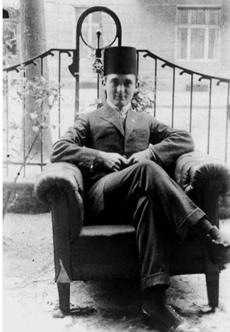
Lev als junger Mann