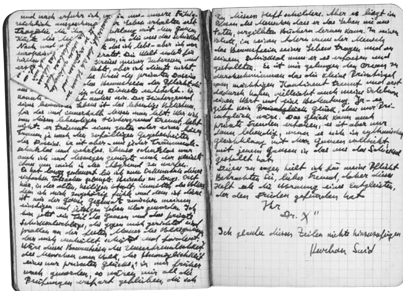
Manuskriptseite, unterzeichnet mit „Kurban Said“