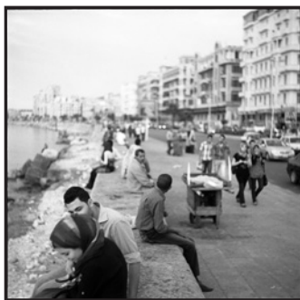
SAMULI SCHIELKE The seafront of Alexandria