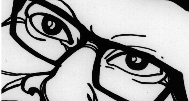
Illustration NSÉ RAMON/ BOFA DA CARA

Please find the English programme with more detailed information on our website: www.insearchofeurope.de