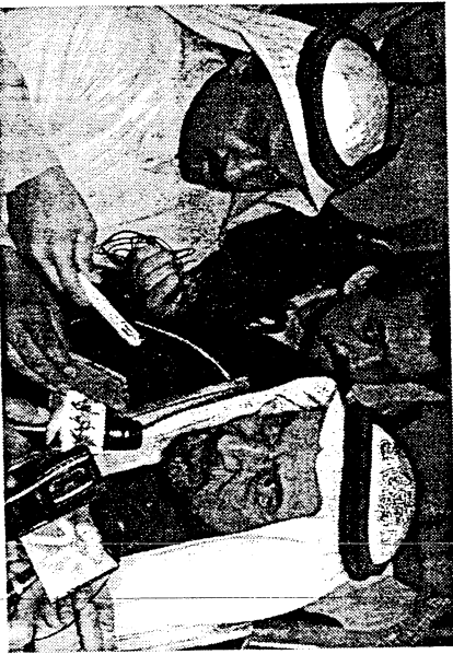
مدني يتحدث لسككاه

المعلومات المطلوبة عن المملكة خصوصاً الكثير من دول العالم الإسلامي وأعطاه صورة واضحة وحقيقية عنها.. لاسيما ان سفارات المملكة في الخارج تقوم بدور كبير في هذا المجال.. هذا وقد تحدث الوزير في افتتاح هذه الندوة بوضعه متفقا وحاملاً هم الي نخبة من المثقفين معتبراً ان ثورة الاتصالات سمته بارزة من سمات العصر خاصة في التأسيس للتواصل الثقافي معتبراً ان كل الثقافات مفتوحة للتفاعل بين الاجناس لا تفي التعدد.