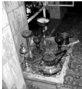
Paraphernalia used for dhikr recitation