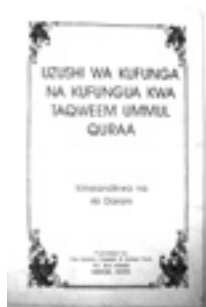
Text discussing the centrality of time